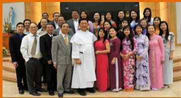
Cùng nhau ta vui hoan ca tình yêu Thiên Chúa đến muôn đời....