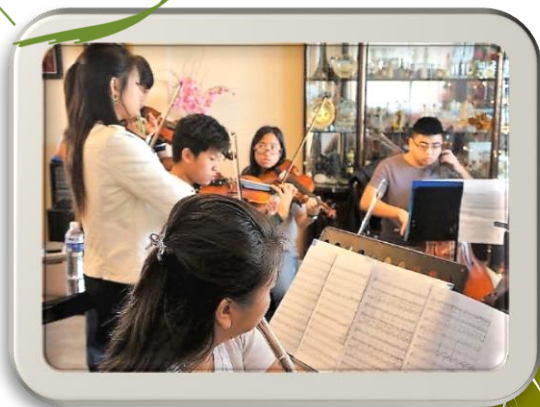
Ca Đoàn Thành Tâm Ngợi ca & tôn vinh Thiên Chúa...