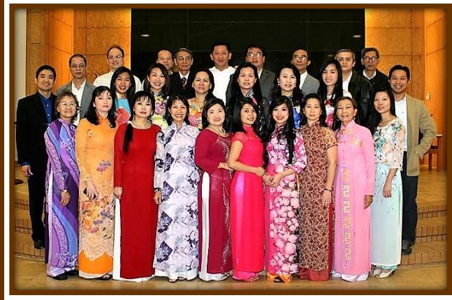
Ca Đoàn Thành Tâm