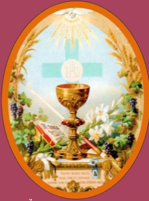
Bổn Mạng Ca Đoàn: Mình Máu Thánh Chúa Kitô