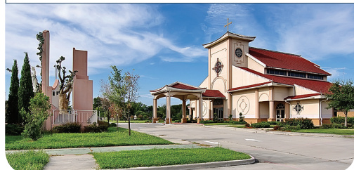
GIÁO XỨ ĐỨC MẸ LA VANG - WWW.LAVANGCHURCH.ORG

Từ những tuần đầu tiên của đại dịch, Hội đồng Kitô giáo châu Á đã thu thập những kinh nghiệm của nhiều cộng đoàn tham gia vào việc mua thiết bị y tế, trong việc chuẩn bị các cơ sở tiếp nhận cho việc cách ly và