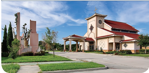
GIÁO XỨ ĐỨC MẸ LA VANG - WWW.LAVANGCHURCH.ORG