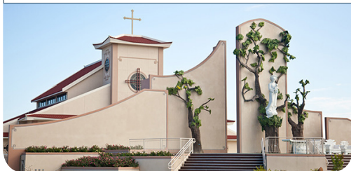
GIÁO XỨ ĐỨC MẸ LA VANG - WWW.LAVANGCHURCH.ORG