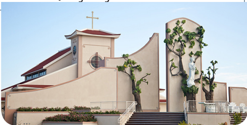
GIÁO XỨ ĐỨC MẸ LA VANG - WWW.LAVANGCHURCH.ORG