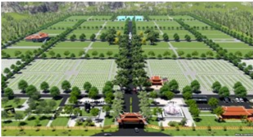
(Ảnh mô hình nghĩa trang cho các cán bộ cao cấp).

hectare, tương đương một phường lớn ở nội thành Hà Nội, dự án có vị trí ở huyện Thạch Thất, dưới chân núi Ba Vì, cách trung tâm Hà Nội 40km về phía tây. Thông tin từ bản quy hoạch cho thấy sẽ có 105 hộ dân phải di dời để nhường chỗ cho dự án.