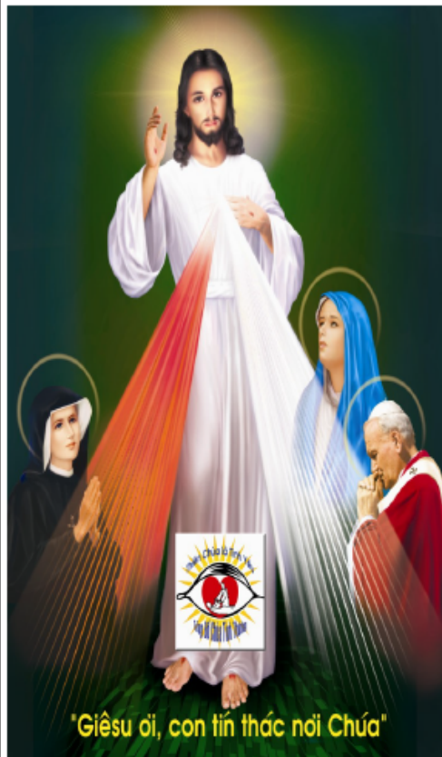
"Giêsu ơi, con tin thác nơi Chúa"

như vậy, nhưng bên cạnh đó, những người không đồng ý đã không có tiếng nói giữa sự cuồng nhiệt tâm tôi thông tri, họ âm thầm theo dõi, và lặng lẽ làm những gì có thể làm được, nhưng sự im lặng của họ xem ra đã như thể đồng lõa, gián tiếp khẳng định chuyện tôn sùng lãnh tụ ngoại bang, tiêu diệt người bất đồng chính kiến là chính đáng!