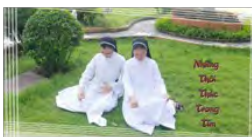
THIÊN THẦN ÁO TRẮNG (Nguồn: Ephata 797)

Ngồi bên mâm cỗ, tôi cứ nghĩ mình đang được dự bàn tiệc Nước Trời chẳng. Sự thánh thiện của màu trắng nơi chiếc áo Dòng, nơi khăn phủ bàn, phủ ghé lẩn át cả hoan trường. Ở đây có rất nhiều Thiên Thần Áo Trắng, và tôi ước nguyện sau này con mình cũng sẽ trở thành một nữ tu đẹp như em, Thiên Thần của Chúa.