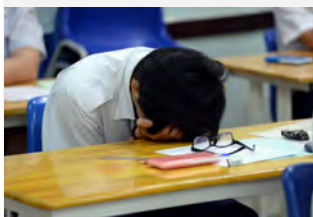
Một thí sinh căng thẳng trước giờ thi trong kỳ thi THPT quốc gia 2017 tại TP.HCM

TTO - Tâm sự của một đứa con ra sức học 'cho mẹ vui' ngay trước thời điểm kết thúc năm học 2017-2018 khiến người đọc xót xa.