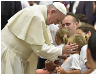
Linh Tiến Khải - Vatican

ĐTC Phanxicô đã nói như trên với 8.000 tín hữu và du khách hành hương tham dự buổi tiếp kiến chung thứ Tư hàng tuần trong đại thánh đường Phaolô VI. Trong bài huấn dụ ĐTC khai triển đề tài: “Người sẽ không có các thần nào khác trước mặt Ta” (Xh 20, 3) và Ngài giải thích tội tôn thờ thần tượng, rất thời sự ngày nay. [Video Embed: ĐTC tiếp kiến chung 01/08/2018]