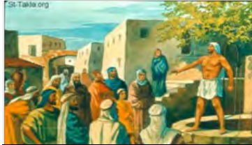
(Tranh minh họa Ngôn Sứ Mikha đang cảnh báo dân).

bề trong, áo là bề ngoài. Quen nhau càng lâu thì người ta càng biết tính nhau, ai thẳng ai cong cũng thể hiện phân nào (chứ chẳng bao giờ hiểu hết nhau). Sợ hay không là ở “điểm” đó. Còn với người lạ (hoặc chưa quen), người ta thường nhìn vào bề ngoài mà “đánh giá” – dù biết rằng “chiếc áo không làm nên thầy tu” hoặc “tốt danh hơn lành áo”. Nhưng con người là thể, ít nhiều cũng bị chi phối bởi ngoại tại. Do đó mà người ta sẵn sàng mua danh, mua tước, thích vênh vang khoe mẽ, ý lại. Thậm chí có kẻ còn ngông tới mức “chưa đỡ ông nghề đã đe hàng tông”.